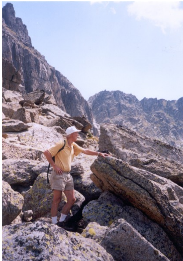
Blokken bij de Bassiero