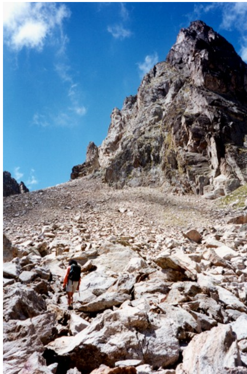
Pic de Subenuix