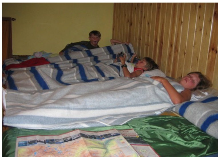
Overnachten in een berghut

Vanaf de hut neem je het pad omlaag. Bij de splitsing na ca. 5 minuten ga je rechtsaf richting Espot. De afdaling naar Espot duurt nog ongeveer 2 uur.