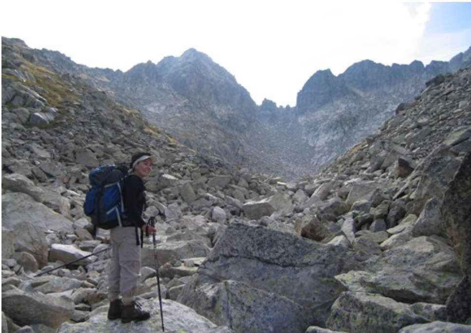
Col de Contraix